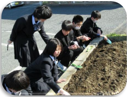
学校の入り口付近に生徒会執行部のみんなで「ひまわり」の種を植えてくれました。夏に大きく花を咲かせてほしいです。