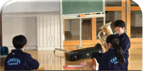
1年生を迎えて、盛り上がっていた部活動。一日も早い再開をみんなが願っています。